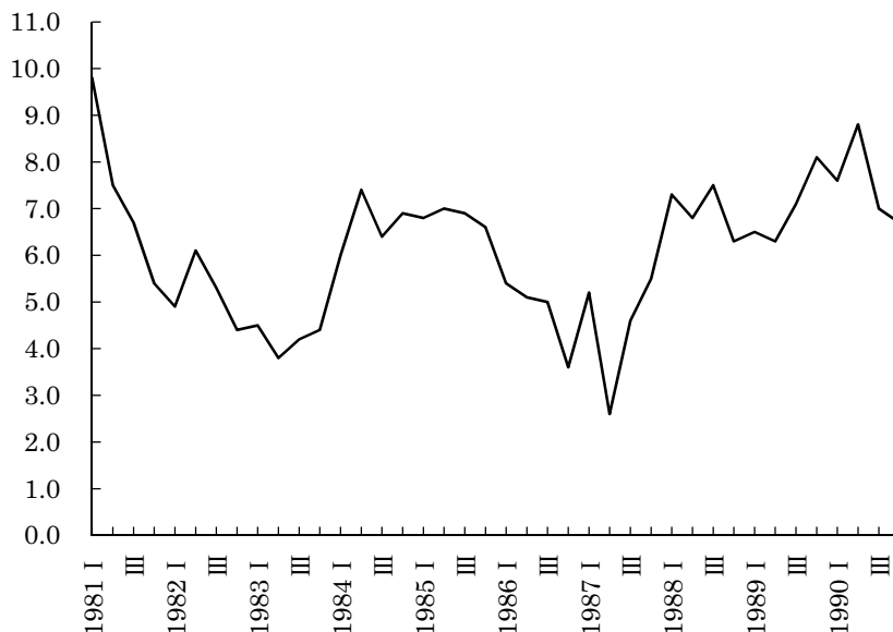
図1 名目GNP四半期別成長率（対前年同期比、％）

宮澤は、「問題の始まり」はプラザ合意を契機とする円高だと見なしていた 6) 。「それだけ国の通貨の価値の変動があったことは減多にないことでありますし、それに対して日本経済が対応をしたり、しそこなったりして、結局いまの姿は、どうもそのことの結果ではないか」 7) と後年、述べて