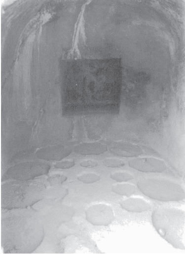
圖 1 1074 窟