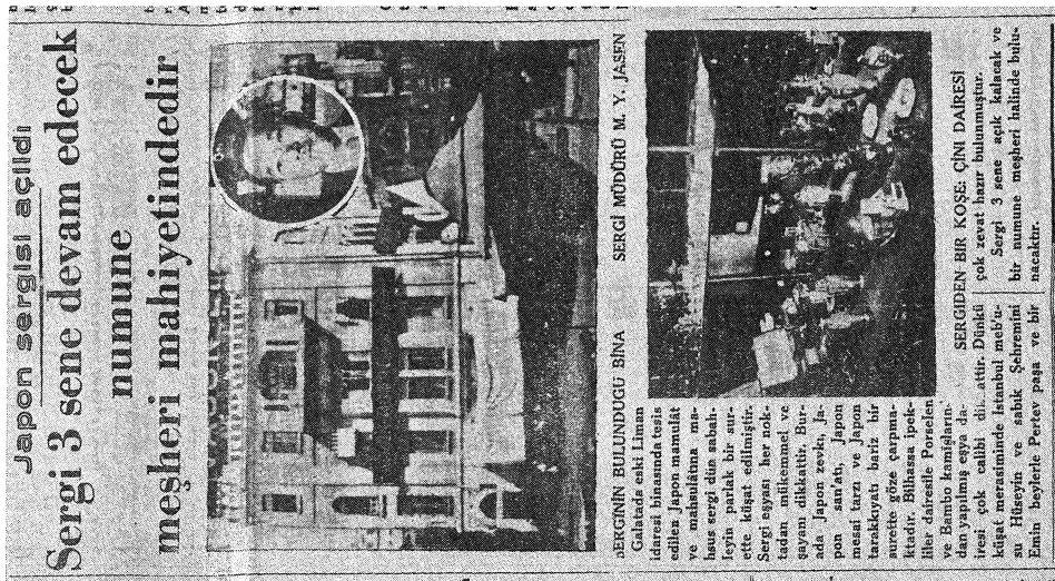
写真1：コンスタンチノーブル日本商品館開館式（İkdam 紙，1929年9月2日）