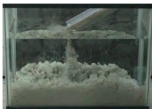
普通のコンクリート