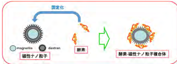
図 1. 酵素-磁性ナノ粒子複合体の作製

多くの酵素において、粒子表面に固定化することで、熱安定性や保存安定性の向上が確認出来ます。また、磁性粒子を用いる事で、磁場を用いてコントロールすることが出来ます。