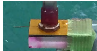
図3 採血実験後の写真