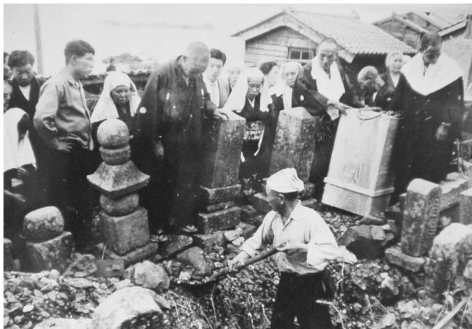
写真 1 I 集落における土葬

土葬期の T 集落が火葬に関わるもう一つの機会、火葬を行う周辺集落での経験であった。T 集落の人々から聞かれる言葉として「I 集落は御門徒だから火葬をしていた」というものがある。I 集落は T 集落に隣接する、漁業を中心とした集落である。当時の火葬場は T 集落と I 集落の境界近くに置かれていた。多くの薪を必要とする上に火力も十分でないため、遺体を焼き上げるまでには数日を要したという。薪の調達も容易ではなく、時期によっては数日間遺体を放置せざるを得ないこともあった。火葬を行っていた他集落には、火事にならないよう火の番をする中で、餅や芋などを焼いて食べたことを記憶する人もいる。