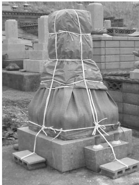
写真3 新たな死者のためにビニールシートを巻き付けた墓碑

その結果として、トムライアゲまでの個別の死者に対する儀礼も、「〇〇家之墓」の墓碑を対象とすることとなった。かつて土葬された新たな土饅頭に対して、三回忌までむしろがかけられていた。現在では、新たな遺骨が納められたのち、墓碑に対してむしろやビニールシートを巻き付けるようになっている。つまり現在の墓碑は、集合的な「家の墓」としての性格と、個別の死者を偲ぶ対象という異なる性格を同時に有している。