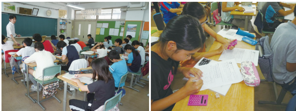
図3 第2回授業の授業風景