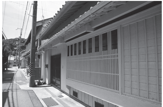
写真6 和歌山県太地町の町並み