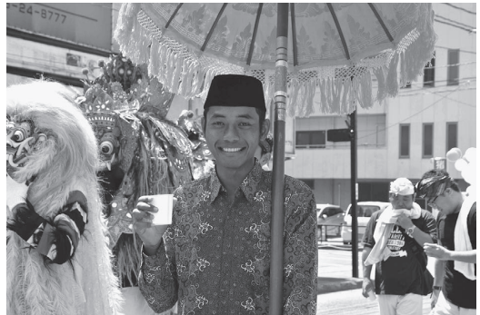
写真8 インドネシア・パレードに参加するインドネシア人技能実習生