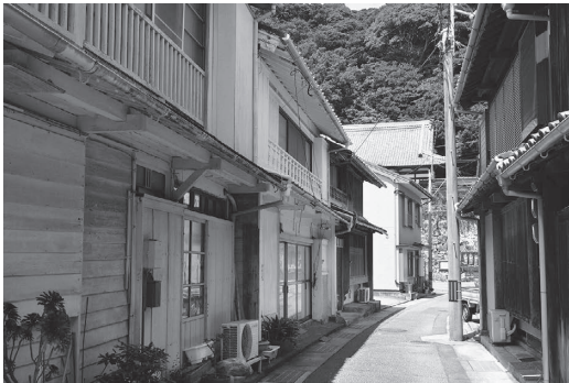
写真5 和歌山県太地町の町並み