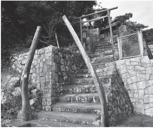
写真3 鯨骨鳥居 (和歌山県太地町)