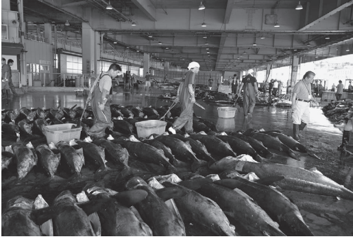
写真9 宮城県気仙沼市の魚市場。サメが水揚げされたところ