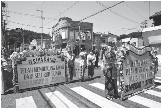
写真7 宮城県気仙沼市のインドネシア・パレード