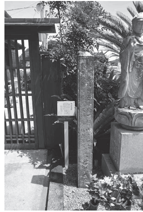
写真4 鯨の供養碑(和歌山県太地町東明寺境内)