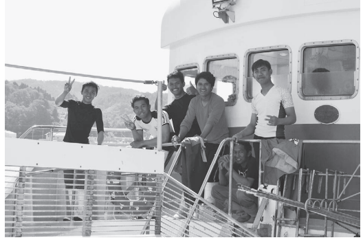
写真10 宮城県気仙沼市に寄港したカツオ漁船で働くインドネシア人技能実習生