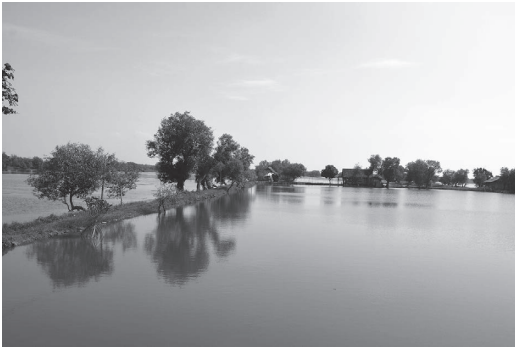
写真1 粗放型エビ養殖池 (インドネシア・東ジャワ州シドアルジョ)