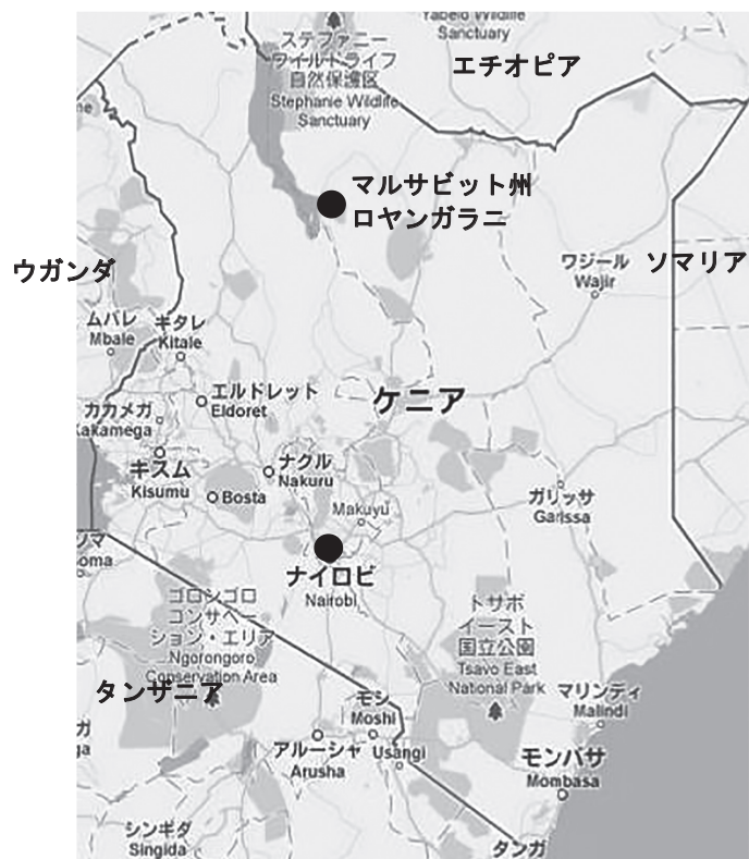
図3 ケニア共和国地図

そして第二回のプロジェクトを終えたのちに、CIAはその干ばつ被害の支援をマルサビット州のロヤングラニを中心に焦点化し、第二回目のプロジェクトにおいて設置した貯水タンクを有効利用するかたちで、ロヤングラニにある湧水とタンクとを水道敷設によって繋げ、地域の水問題を恒常的に解決しようとした。