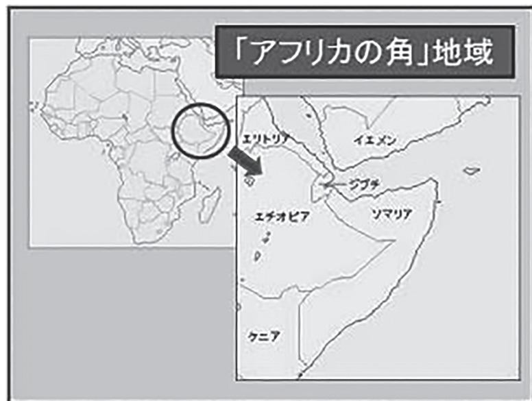
図1 「アフリカの角」地域の地図

「アフリカの角」地域というのは、アフリカの北東部にあるエチオピア南部、ソマリア全域、ジブチ、ケニア北東部一帯を指したものである（図1を参照）。ちょうどアフリカを雄牛と見立て、紅海以南のソマリア半島を角の部分と位置づけることから、その呼び名は発している（Fukui & Markakis 1994）。本論文が分析の対象とする「アフリカの角プログラム」はNGOのジャパン・プラットフォーム（以下JPF）が組織化し、本地域をカバーする干ばつ対策のためのJPFに加盟しているNGO諸団体によるプロジェクト群のことである。この節では、