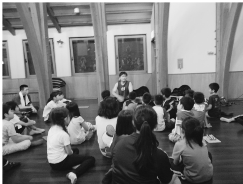
写真-5 「ファンタジー」

ファンタジーを駆使してグループを促進するプレゼンテーション。子どものキャンプでの一コマ(山路)。