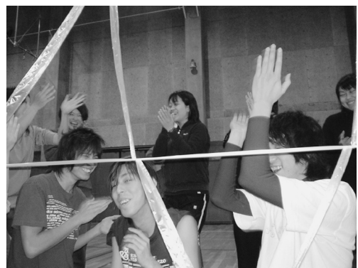
写真-2 「達成の瞬間を共有」

グループにアドベンチャーのある活動中、仲間の失敗を喜びの感情で共有するメンバーたち（大学の体育にて。田代撮影）。