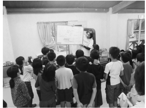
写真-4 「プレゼンテーション」

日常生活では出会えない、さまざまなアドベンチャー体験に向き合い、仲間との協働でこれに臨むことで、積極的に、肯定的に「自己」と向き合う契機をつくっていく。スポーツやダンスなど総じて「あそび」の場面では、完全に同じ動き、状