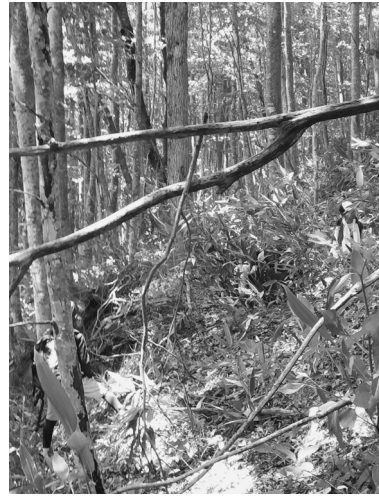
写真-3 「正解のない道程」 仲間と共にゴールを目指す道。不安、困難、不測の連続だが、自由である(子どもたちのキャンプの遠征中。田代撮影)。

環境(自然)や状況(正解を前提としないプログラム)による不安定で鮮やかな時間が、生徒・学生の心身に具体的な影響をもたらし、キャンプだからこそグループでの様々な関係性が浮き彫り