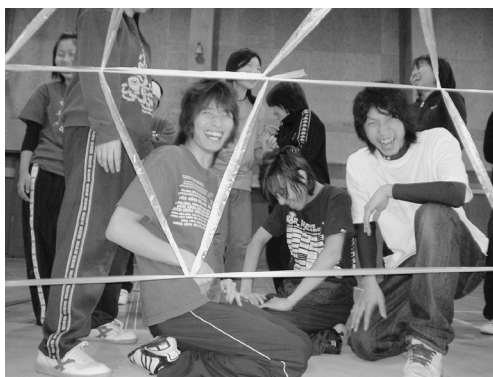
写真-1 「失敗も楽しさに」

（高木幹夫：「学び家」で行こう～学習習慣、その幻想から抜け出す～）みくに出版，2014. p. 19.）