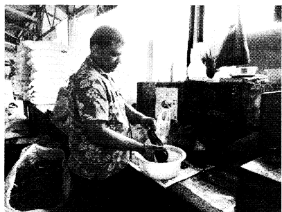
写真2a カバの絞り出し (ナウソリ市場)