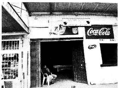
写真3 ナウソリのカババー