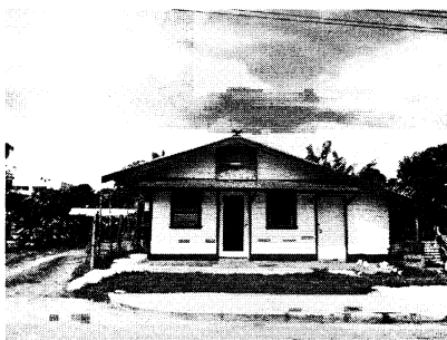
写真5 スクアロファのカバサロン