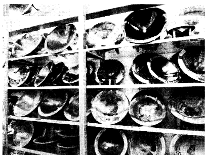
写真4 ナンディ国際空港の土産物店