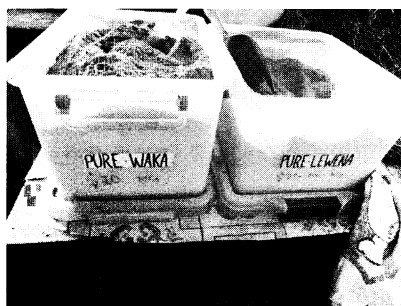
写真1b 粉にしたカバの根 (左) と根茎 (右)