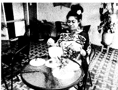
写真6 レストランでのカバのおもてなし