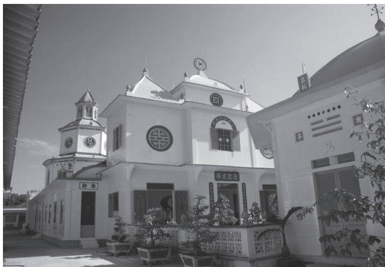
写真2：カオダイ真理聖会 デイン・トゥオ (定祥) 聖座 在ミイ・トオ市