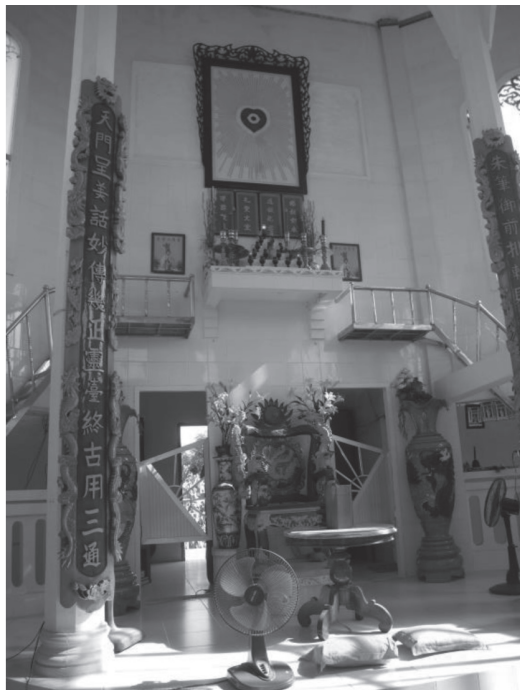
写真1：真理聖会はカオダイ教のシンボルとしての天眼を使用せず、祭壇中央の額の中のハート型のシンボルで紅心を表す。(ミイ・トオの定祥聖室にて)