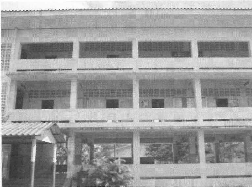
写真1 ナムケム村の小・中学校

5. http://dpfjp.thaiict.org/ (2012年12月現在)