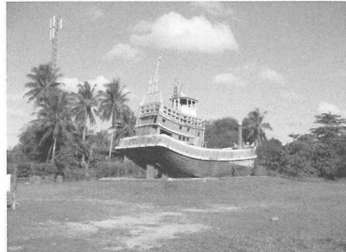
写真4 津波メモリアル