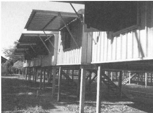
写真3 津波被害直後の仮設住宅