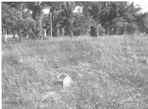
写真5 メモリアルパークの墓地