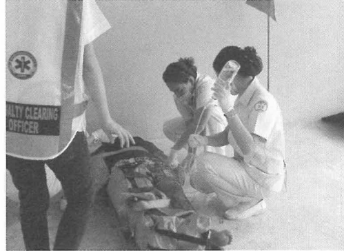
写真2 防災訓練の様子