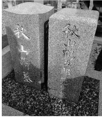
図3 秋山断の墓石