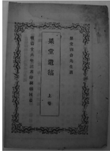
図1 『果堂遺稿』表紙 (筆者所蔵)