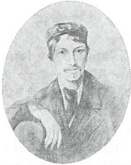
R.L. スティーヴンソン (26歳)