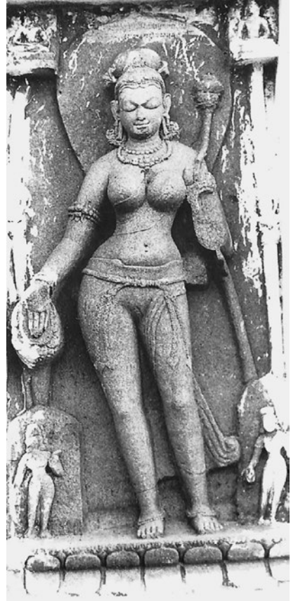
図4. 白ターラー像 9C末~10C初 オディシャー州ソーランプル ラグナータ寺

今回の成果を基に、陀羅尼経典から神格化された五護陀羅尼と、既存のイメージから神格化されたマーリーチーの特色を比較考察し、経典と神格化の関連性について今後さらに検討したい。