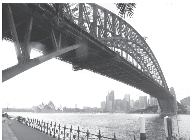
図4 ハーバーブリッジとオペラハウス（昼間）