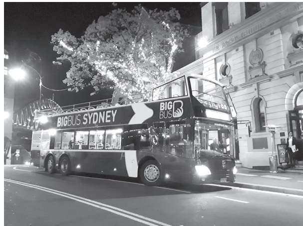
図2 シドニーオープントップバス車両

同氏は1992～98年にゴールドコースト駐在員として同国に勤務し地域統括事務所があるシドニーには頻繁に訪れる機会を得、そこで感銘を受けるのがハーバーブリッジであった。ハーバーブリッジはシドニー湾にかかる橋で南側のシドニー中心部と北側のノース・シドニーをつなぐ鋼鉄製アーチ橋であり、1920～30年代に当時の土木技術の粋を集めて建設された。同氏はシドニーの「顔」としてのハーバーブリッジの「多様な表情」を観光客により深く伝えることができないものだろうか、との想いをもち続けることになる。