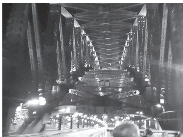
図6 オープントップバスから見たハーバーブリッジ

走行ルートを設定する上では、ステージの幕が上がるようなイメージした、という。具体的には、地下を走行後、地上に出たところで、いきなり照明に照らし出されるハーバーブリッジやオペラハウスの威容が観光客が目飛びこむような「劇的な演出」を意識した。またその背面にはシドニー中心街の高層ビルの明かりも華を添える。さらにオープントップの座席からは、巨大な鉄製構造物であるハーバーブリッジの鉄骨が迫力をもって迫り、シドニーの歴史遺産として産業観光の要素が強く意識される。（図6参照）