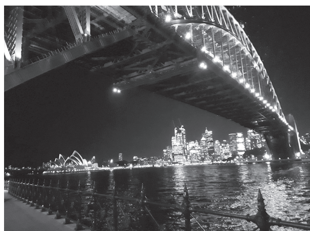
図5 ハーバーブリッジとオペラハウス（夜間）