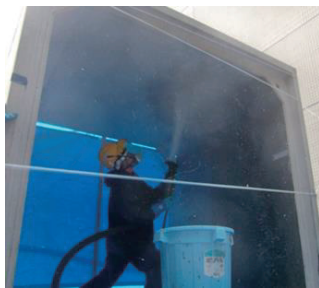
図-2 吹付け養生施工状況