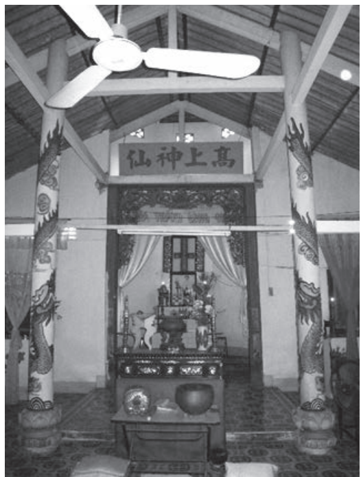
写真3 カン・トォ郊外、カオダイ聖会チュウ・ミン・ロン・チャウ派の祭壇