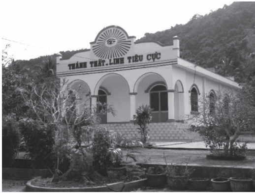
写真1 フウ・クウオクの靈道極聖室