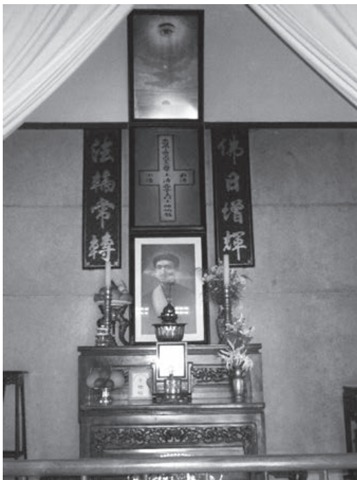
写真2 カン・トォのカオダイ聖会チュウ・ミン・ヴォ・ヴィ派祖庭にある祭壇