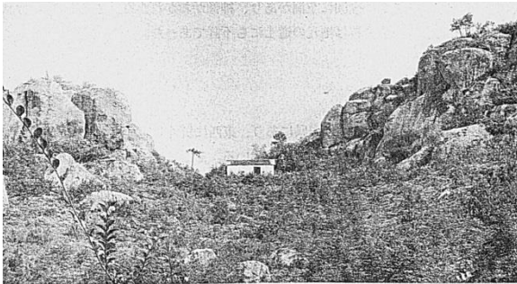
麻姑山丹霞洞（『洞天福地研究』第2）

同じ『洞天福地研究』一号には、麻姑山の丹霞洞も報告されている。これは第十福地として『天地宮府図』に記録されるが、洞窟を指しているわけではないようである。山中の比較的開けた地を示しているという。これも写真で見る限りは奇岩に囲まれた叢原である。奇景といえば奇景ではあるが、それよりもむしろカール状の窪地から天空に抜けるような地形が、この場合は重要なのであろう。一種の天との交感の地という状態である。