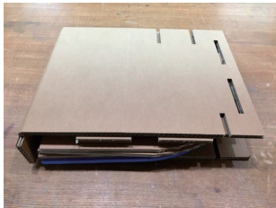
図1 分解収納時の状態

このトイレのコンセプトは備蓄品としてコンパクトに収納でき、必要な時は短時間で誰でも組み立てて使用できることです。トイレの本体に2層強化段ボールを使用し、座ったときの強度と快適性を高めるため便座は強化段ボール2枚とクッション材1枚の3重構造としました。分解した状態は450mm×370mm×50mmのサイズに収まり(図1)、組み立てると高さ382mm、幅370mm、奥行き420mmのサイズになります(図2)。分解したサイズがコンパクトなので、避難所や家庭での備蓄品としてスペースをとらないのが特徴です。組み立て手順は以下の通りで、初めての人でも3分程度で完成します。①側板に4ヶ所の折れ目を入れて五角形に折り曲げる。②裏板を側板のホゾ穴に差し込む。③底部補強板と上部補強板をホゾ溝に差し込む。④底板を便器の内側から裏板に差し込む。⑤本体の上部に2枚の便座とシートクッションを側板上部に差し込む。匂い対策のため便座蓋も標準で装備しています(図3)。実際に使用するときは、2枚の便座の間に使い捨てパックや大型のビニール袋をセットし、使用後に凝固剤や防臭剤を入れて匂いの対策をした後、ゴミ袋にまとめて廃棄します。トイレ本体は段ボールなので、使用後に分解して廃棄することは容易です。