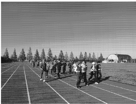
写真 1 ウォーキングの様子

パワフルボディ講座は今年で 4 年目 (4 回目) を迎え、今回の研究協力者 25 名中 15 名は、過去にもご参加いただいた方々であった (5 名は 4 年連続、6 名は 3 年連続そして 4 名は 2 年連続)。例年と同様に、本教室を通して、体力レベル、食習慣および健康関連 QOL が改善されており、比較的健康的な中・高齢者でも、週 1 回 8 週間の教室参加により、身体機能、食習慣および心の健康が向上することが再確認された。今後は、この教室で改善された項目を年間を通じて維持していただくために、自宅等でも実施可能な運動や食事について考えていく必要があると考えられる。