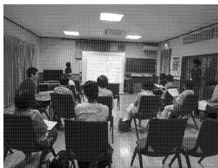
写真3 左：採食健美教室風景、右：食の介護予防教室風景（フィードバック説明）