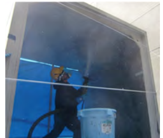
図-2 吹付け養生施工状況