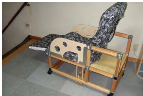
図 1 JOSY を使った椅子

JOSY の基本構造は、国産の杉による角材とそれを連結する金属製ジョイントからなる。木フレームの寸法は断面が 30 ミリ×40 ミリで、長さは 900 ミリまであり、必要な長さにカットして使う。金属ジョイントで木フレームを接合するために、まず木フレームの断端部にアルミプレートを長さ 90 ミリのタッピングビスで固定する。木フレームの軸方向に正確にねじ込むため、角材の両側面に2本の平行な溝を削り込み、その上から単板を貼り付けたフレームを開発した。従って、どの位置で切断しても4つの下孔が正確に現れる。アルミプレートの中心に M6 のネジ孔が開けられており、M6 の六角穴付きボルトで固定する。ジョイントは立方体形状で1側面のみ開口部があり他の面はすべて中心に穴が開けられているのでボルトを通して木フレームを 5 方向に固定することができる(図 2)。